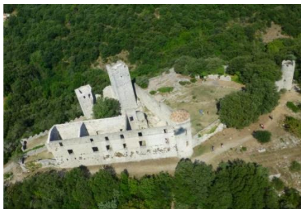
Maintenant ci-dessus Avant ci-dessous