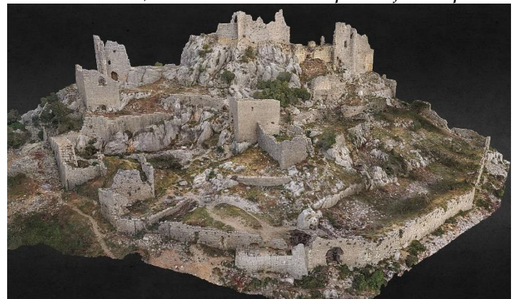
Maquette informatique 3D

- Alain Poulet signale que l'association est reconnue d'Intérêt Général depuis le 31/12/2019. Les dons à l'association sont donc maintenant défiscalisables, toutefois une nouvelle demande est en cours suite au changement de nom..