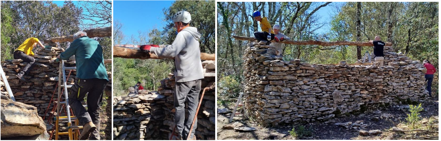
Bien horizontale !