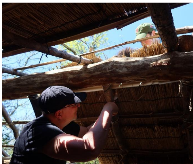
Pendant que certains accrochent les paillons, d'autres découpent la paille pour le béton à la chaux