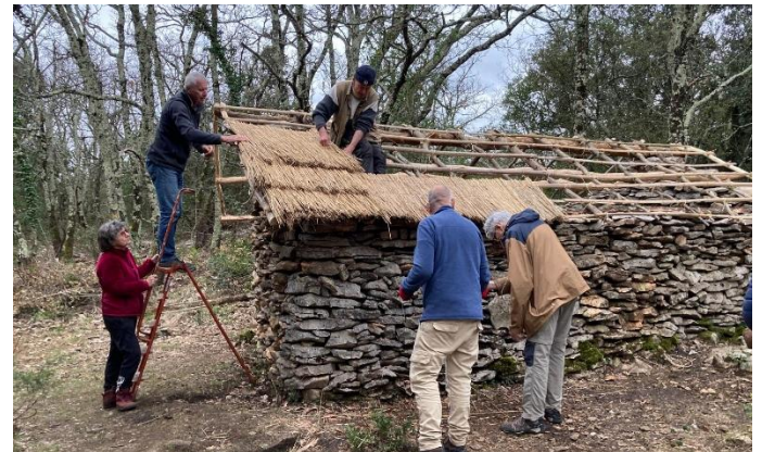
C'est eul paillon qu'est posé par eul pailleur.