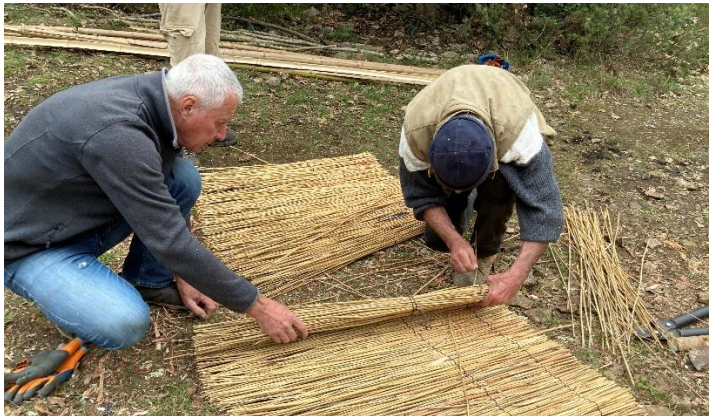
Dérouler les paillons.