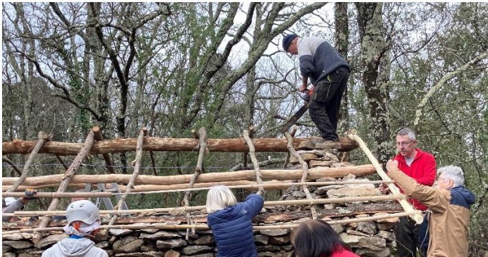
... et le haut des chevrons.