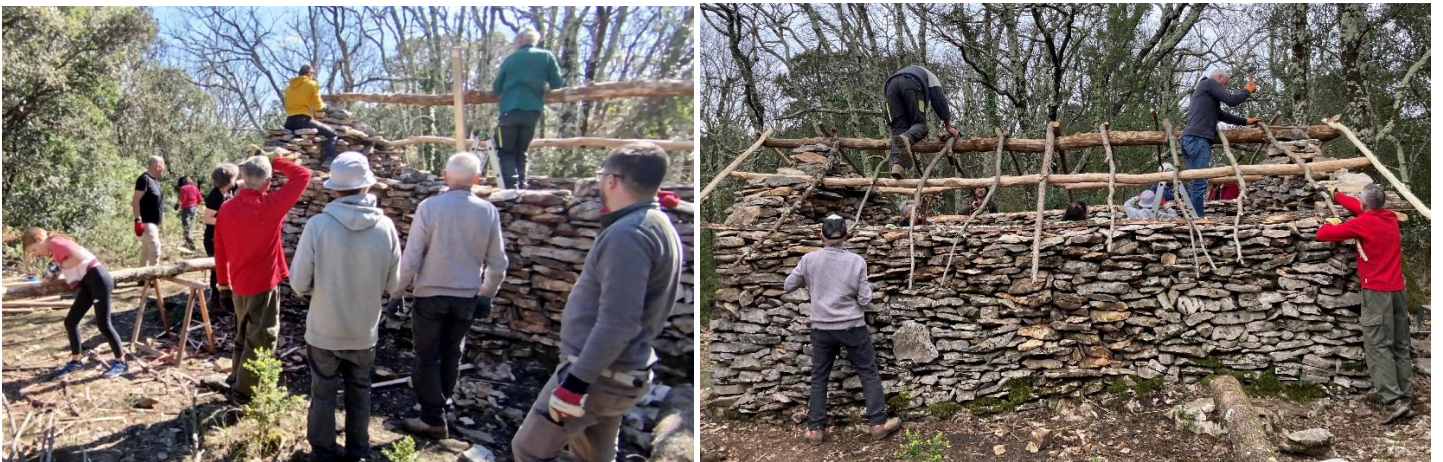
Une panne est posée.