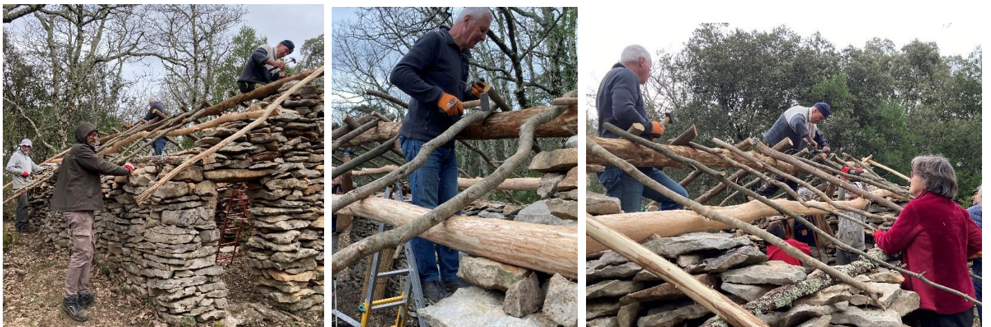
... sur les deux côtés de la cabane.