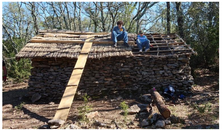
Pose du béton et des tuiles, fini pour ce jour, il faudra revenir pour finir la pose des tuiles.