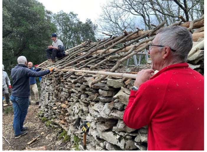
Couper les bambous. Calculer la distance entre les liteaux et la noter sur chaque chevron. Couper le bas et ...