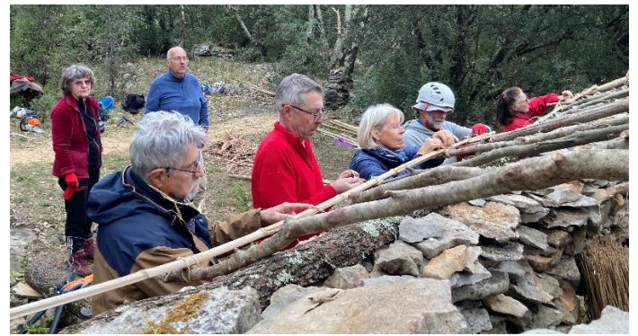
Les liteaux en bambou sont attachés à chaque chevron.