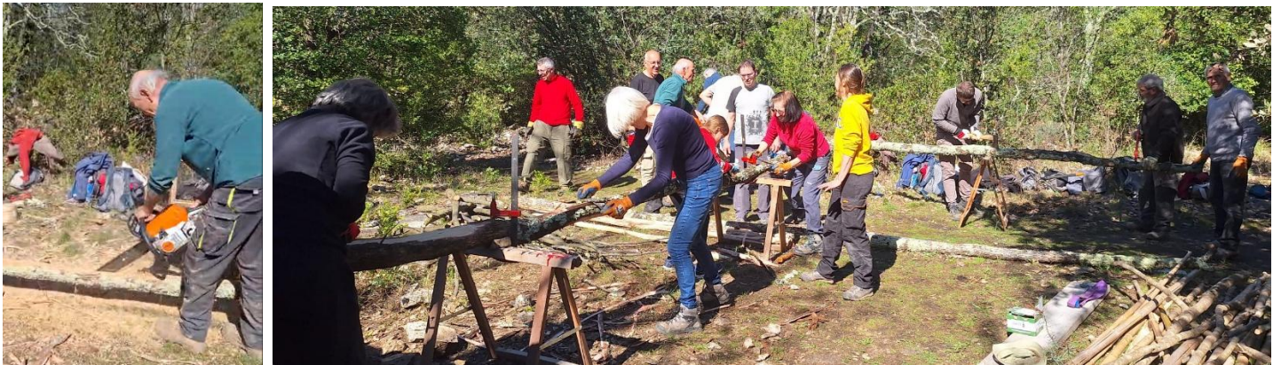
Une poutre sciée en 2 fera 2 pannes. 15 personnes s'activent pour raboter et préparer les chevrons !