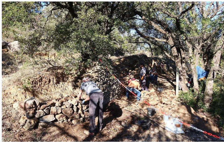
Le 4 e : Aménagement au début du chemin