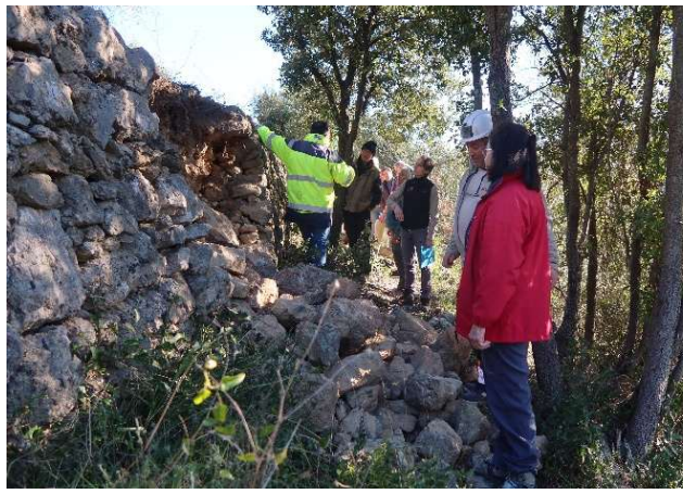
En raison des nombreuses pluies, le mur est écroulé en plusieurs endroits.