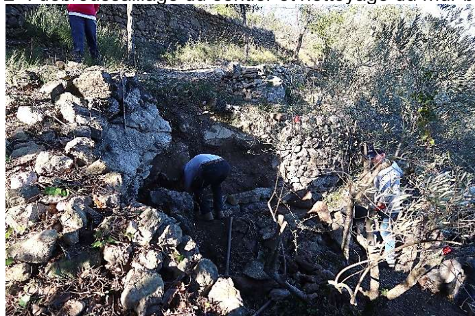
Le 3° un peu plus loin : reconstruction du mur bas