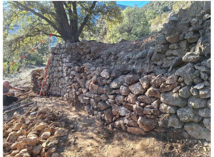
le premier au début du chemin, avant-après