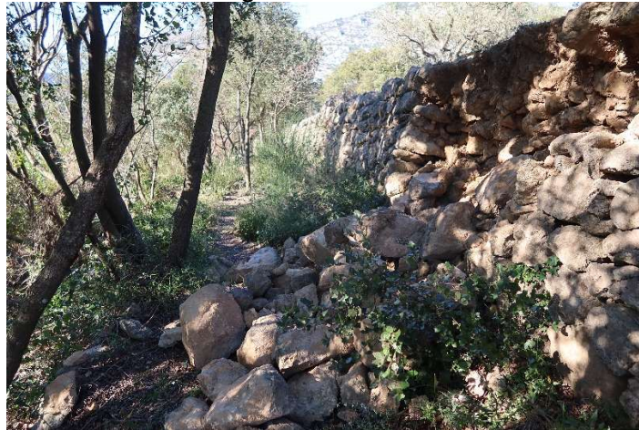
Ce n'est pas fini, il faudra revenir !