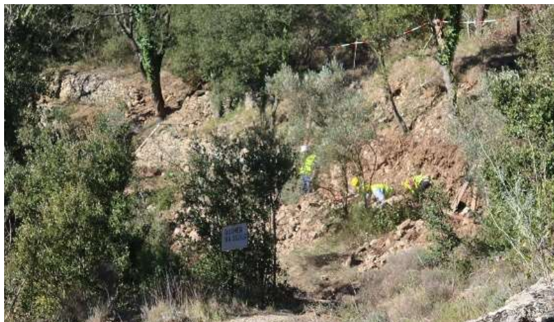
Chemin vu du côté de St-Jean, les ouvriers remontent le mur du haut.