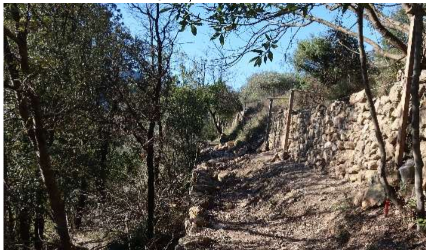
Tronçon reconstruit par les ouvriers du chantier.