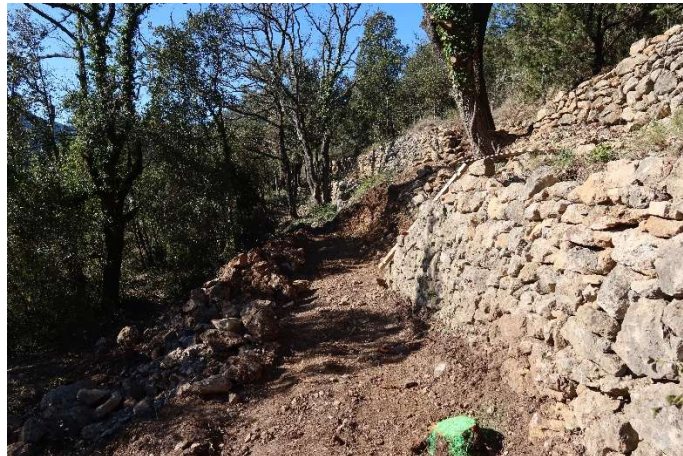
Un sentier a été ouvert sous le chemin afin de reconstruire le mur bas