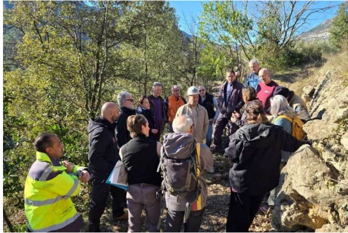
Pic Patrimoine avec les élus locaux et de la CC GPSL et le chantier d'insertion sur le chemin de la Buèges